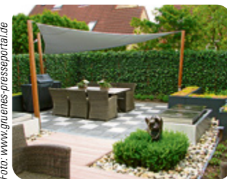
Schatten unter luftigen Sonnensegel.

Über Terrassen und Balkons empfiehlt sich ein großes Sonnensegel. Luftig