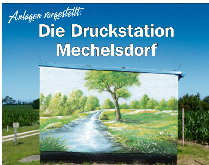
Natur und Technik in gutem Einklang.