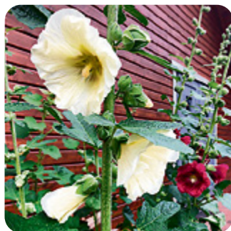
Pfahlwurzler wie Malven erreichen tieferes Wasser.

Dazu zählen zum Beispiel Taglilien ( Hemerocallis ) oder der Sonnenhut ( Echinacea ). Duftend überzeugt der wärmeliebende Lavendel ( Lavandula angustifolia ). Weniger bekannt, aber ebenfalls herrlich aromatisch, ist die Fiederschnittige Blauraute ( Perovskia abrotanoides ). Stauden und Ziergräser aus Steppenregionen dürften sich auch bei uns wohlfühlen. Tiefwurzler sind besser gegen Trockenheit gewappnet, weil sie tiefergelegene Wasservorräte erreichen.