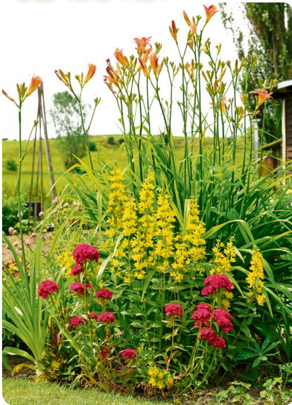
Die hoch aufragende Taglilie kommt mit wenig Wasser aus, ist mit frischem Grün ein Frühstarter im Gartenjahr und besticht ab Ende Juni viele Wochen mit ihren leuchtenden orangefarbenen Blüten.

Wer nicht auf durstige Hortensien, Rhododendren oder Phloxe verzichten möchte, für den könnten automatische Bewässerungsanlagen eine gute Idee sein.