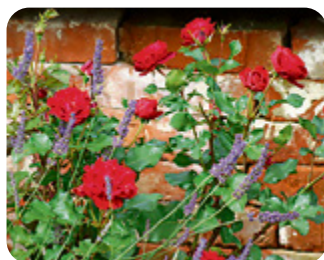
Lavendel liebt Sonne und kommt mit Trockenheit klar.